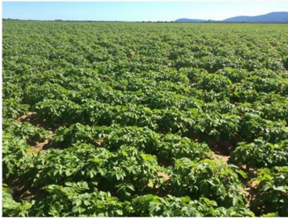
Control – Fumigación con un producto de la competencia