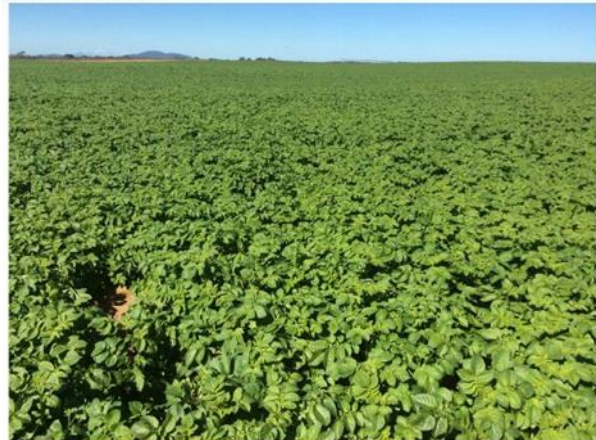
Prueba – penergetic p, G, C, H+